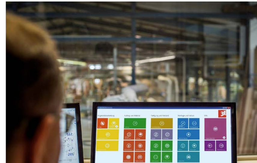
3E-LOOK zorgt voor consistente digitale en efficiënte processen in de raamconstructie.

Mobiele oplossingen maken de volledige implementatie van processen op de bouwplaats of bij de klant mogelijk. Buitendienstmedewerkers kunnen ter plaatse informatie raadplegen en gegevens verzamelen zonder dat ze dit met het kantoor moeten afstemmen - en deze data zonder papierwerk of tijdverlies in het systeem invoeren. Zo wordt informatie snel en vooral betrouwbaar naar het ERP-systeem gestuurd. Een uitgekiend statusbeheersysteem zorgt ervoor dat in het hele systeem actuele informatie beschikbaar is.