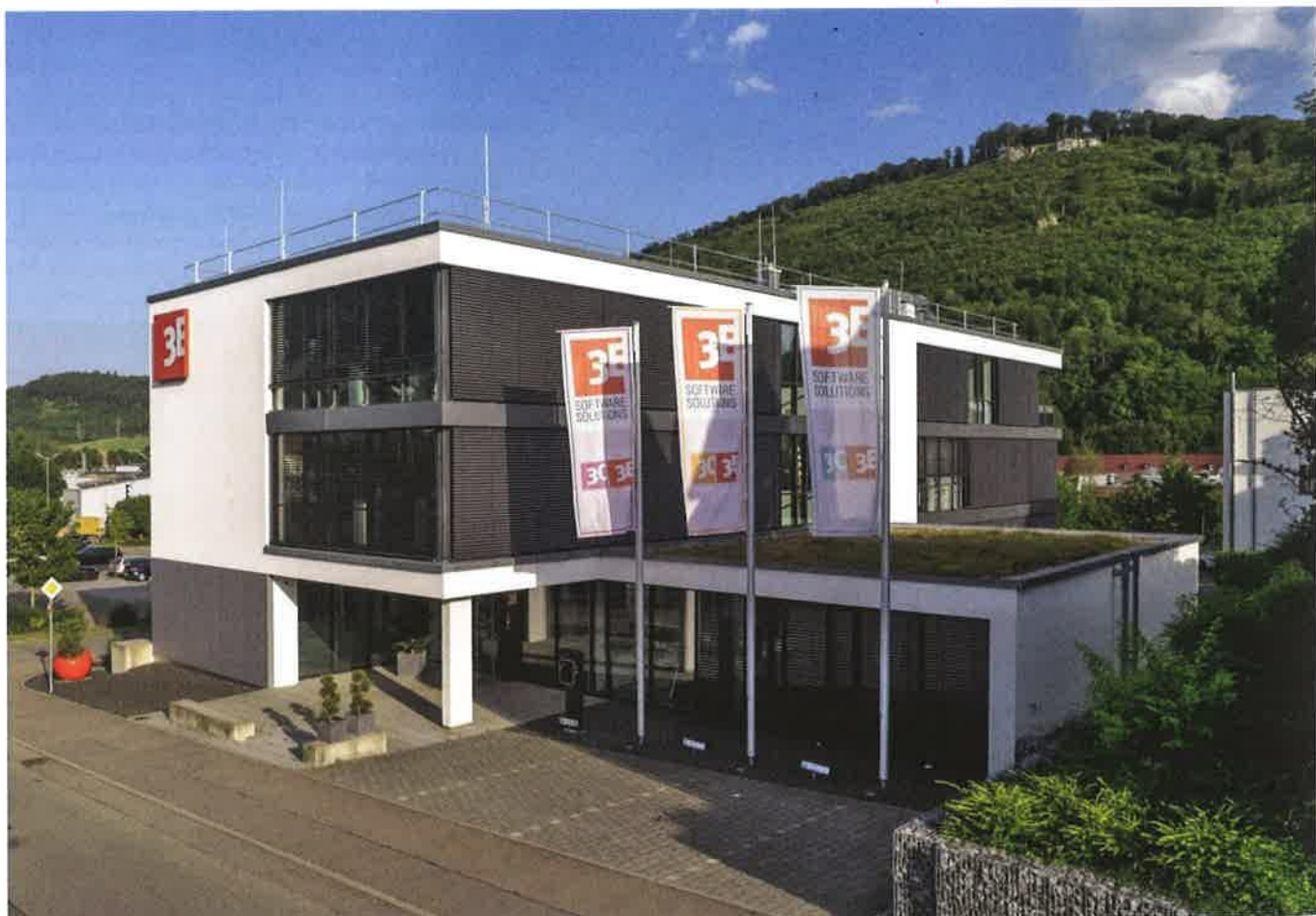
De IT-specialisten van 3E Datentechnik GmbH werken vanuit dit gebouw mee aan de weg naar digitalisering binnen de raamconstructie.

Het is niet altijd gemakkelijk om naast de commerciële en technische aspecten ook het financiële plaatje van een opdracht continu bij te houden. Welk bedrag werd al gefactureerd? Vallen de kosten van een opdracht op dit moment binnen het vooropgestelde kader? Was de opdracht uiteindelijk de moeite waard? Met 'Projectcontrolling' introduceert de Zuid-Duitse softwarefabrikant 3E Datentechnik GmbH, specialist op het vlak van ERP-software voor end-to-end digitalisering bij de raamconstructie, een module waarmee men te allen tijde kosten, omzet en marge van een opdracht in de gaten kan houden.