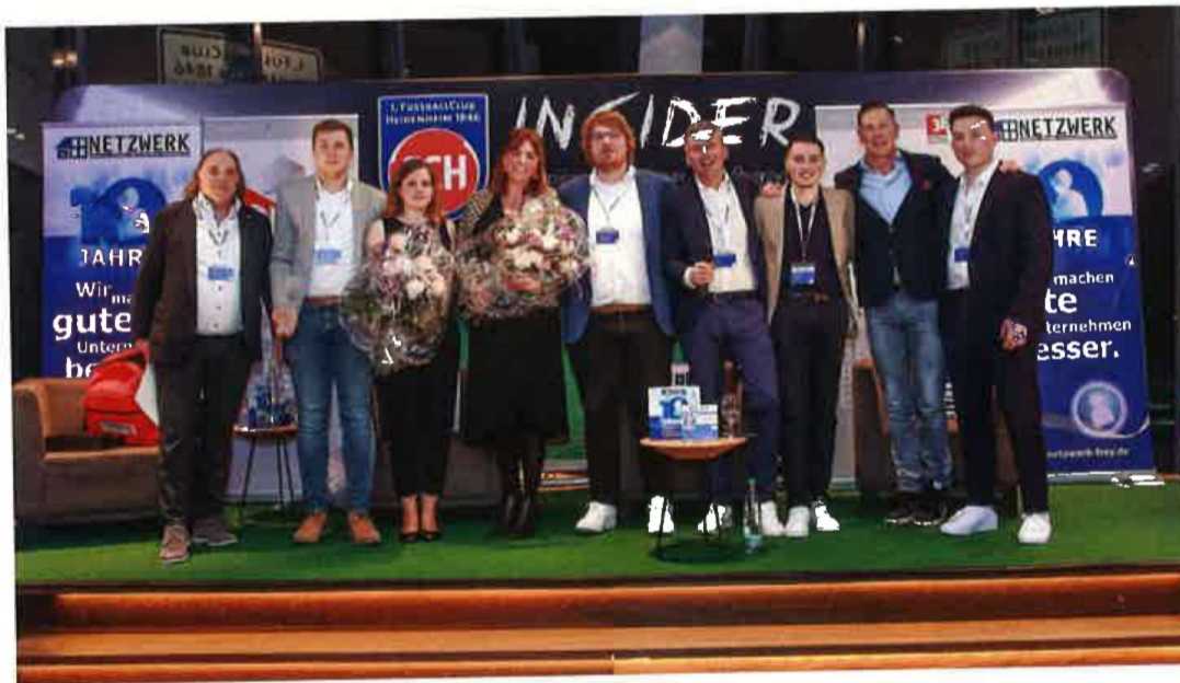
Im Rahmen der Stadionnacht am Vorabend des Partnertages wurde erstmals der neue „GoFuture Award“ des Software-Unternehmens 3E Datentechnik GmbH verliehen. Erster Gewinner des Awards ist die perfecta Fenster Vertriebs- und Montage GmbH aus Westendorf.