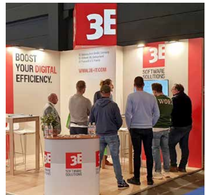
Op Polyclose 2024 werd duidelijk dat digitale oplossingen zeer populair zijn.