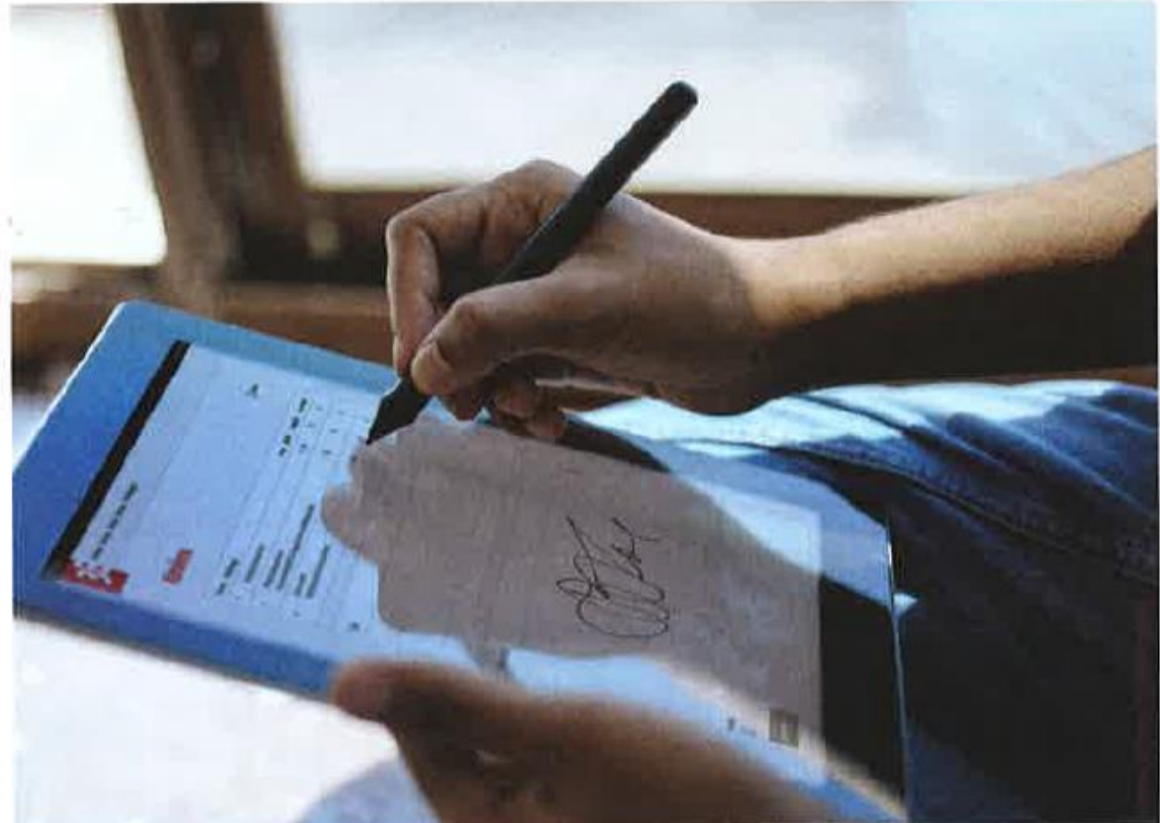
De digitale leverbon, beschikbaar op mobiele apparaten, zorgt ervoor dat ook de oplevering netjes en volledig papierloos kan gebeuren.

3E biedt tevens de software 3E-LOOK Trade voor de handelsondernemingen, waarmee offertes, bestellingen en toebehoren, en zelfs montageprocessen digitaal verwerkt kunnen worden. Verder is er ook de browser-oplossing WEBSales, die zorgt voor een papierloze werking tussen raamfabrikant en -verdelers. De bi-directionele interface tussen WEBSales en 3E-LOOK zorgt ervoor dat dubbel werk bij de invoer van data en bestellingen vermeden wordt.