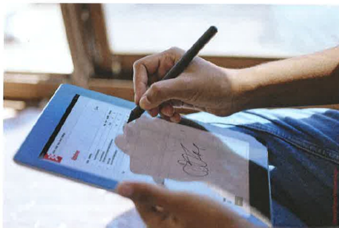
De digitale leverbon, beschikbaar op mobiele apparaten, zorgt ervoor dat ook de oplevering netjes en volledig papierloos kan gebeuren.

Ontdek deze softwareoplossing op BAU München en de FIT Show in Birmingham.